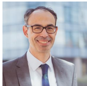
Socio Área IP, datos y tecnología