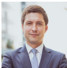
Socio Área de litigios