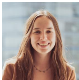
Asociada Área de litigios