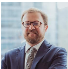
Director Área de libre competencia